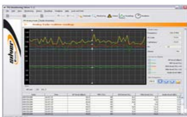
Letture in tempo reale