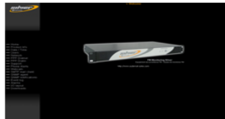
Sito web interno